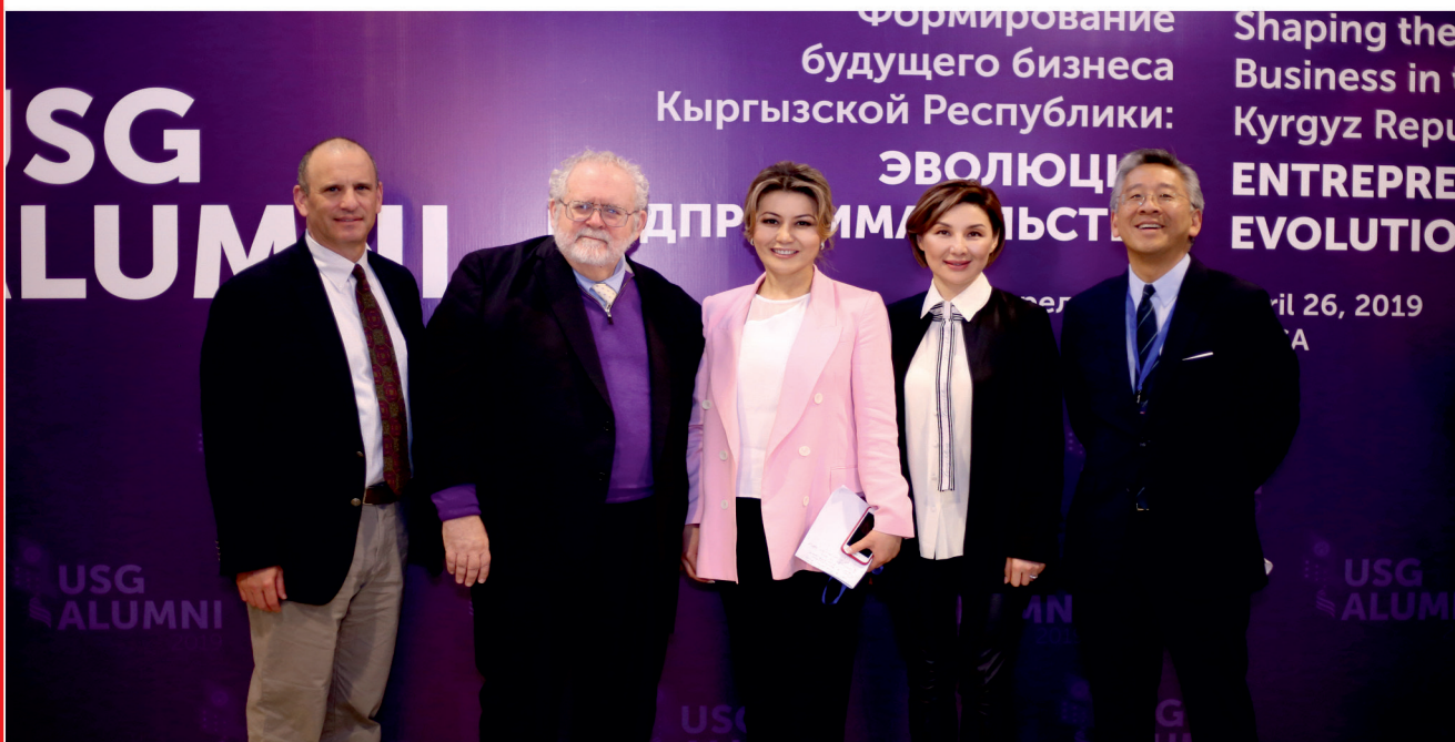
ЕЖЕГОДНАЯ ВСТРЕЧА ВЫПУСКНИКОВ ПРОГРАММ, ФИНАНСИРУЕМЫХ ПРАВИТЕЛЬСТВОМ США

АМЕРИКАНСКАЯ ТОРГОВАЯ ПАЛАТА В КЫРГЫЗСКОЙ РЕСПУБЛИКЕ